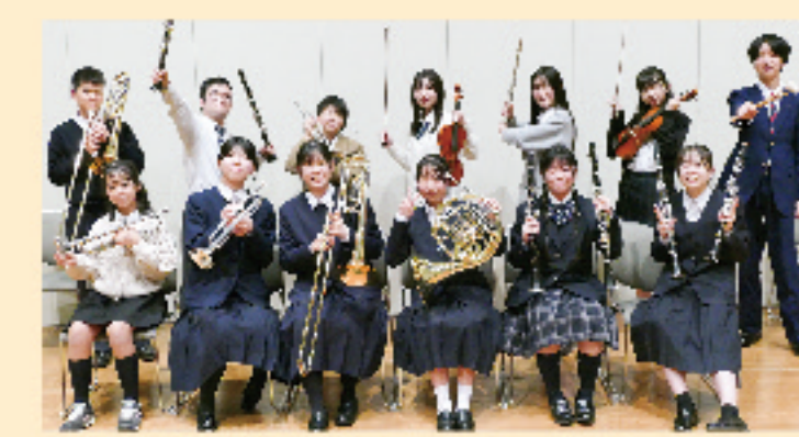
昨年度参加の皆さん

練習日 12月15日(日)・22日(日) 1月5日(日)・12日(日) 13:00~17:00 コンサート日 1月19日(日) 9:00~17:00 会場 さくらめいと 対象 小学生・中学生・高校生